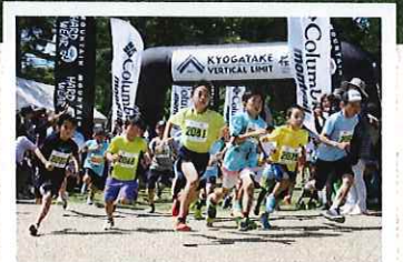
5月 経ヶ岳パーティカルリミット