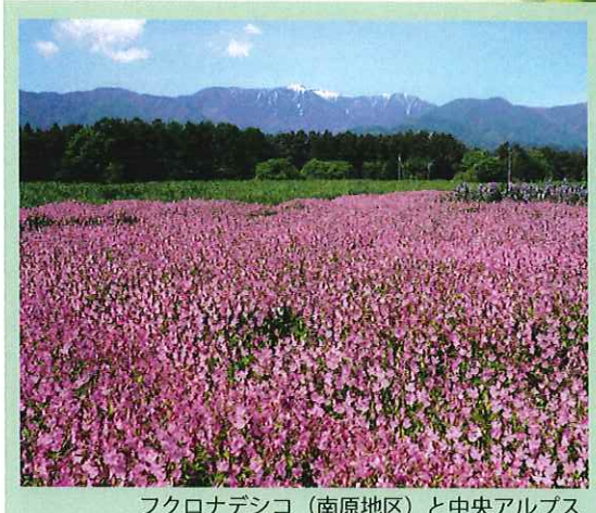
フクロナデシコ（南原地区）と中央アルプス