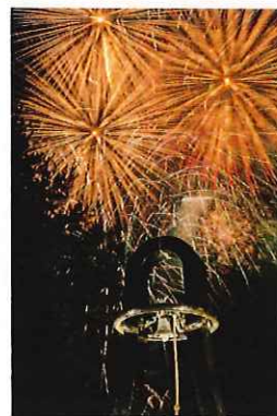
8月 信州大芝高原まつり