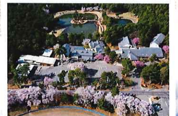
4月 信州大芝高原桜まつり